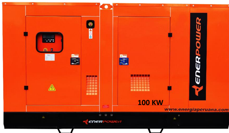
GRUPO ELECTRÓGENO ENCAPSULADO