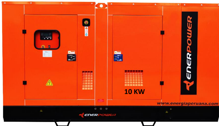
GRUPO ELECTRÓGENO INSONORIZADO