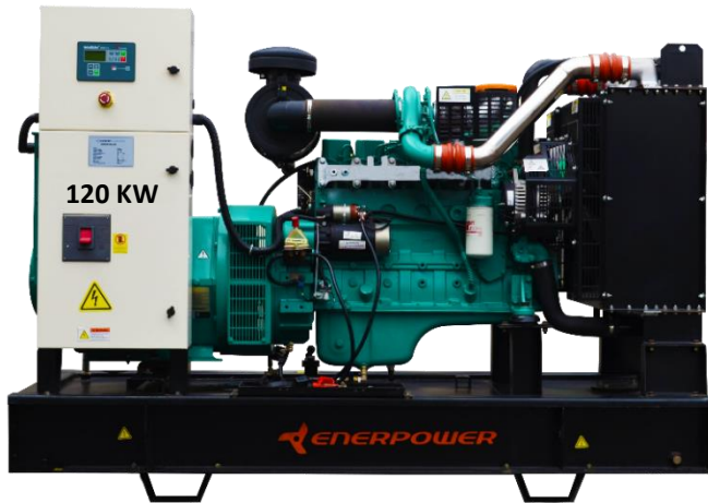
GRUPO ELECTRÓGENO ABIERTO