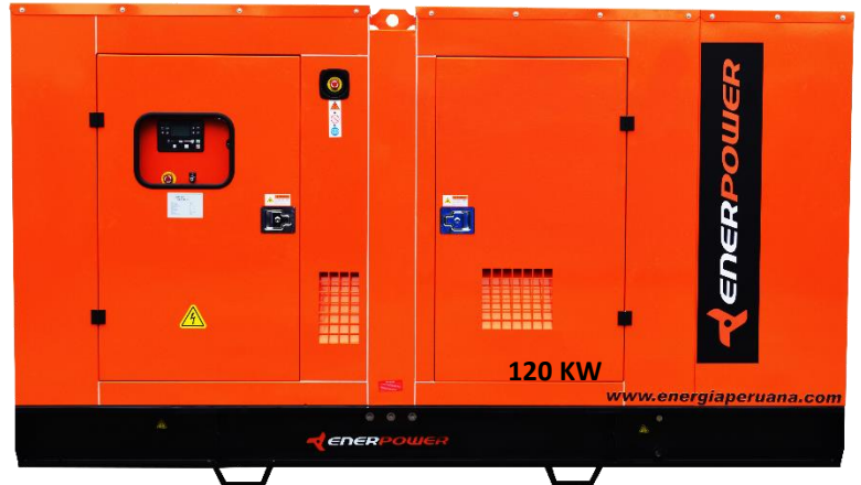
GRUPO ELECTRÓGENO ENCAPSULADO