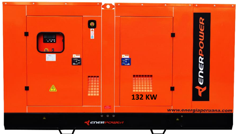
GRUPO ELECTRÓGENO ENCAPSULADO