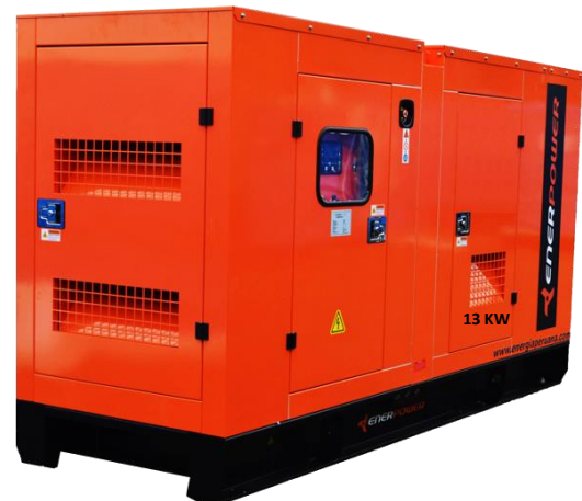
GRUPO ELECTRÓGENO INSONORIZADO