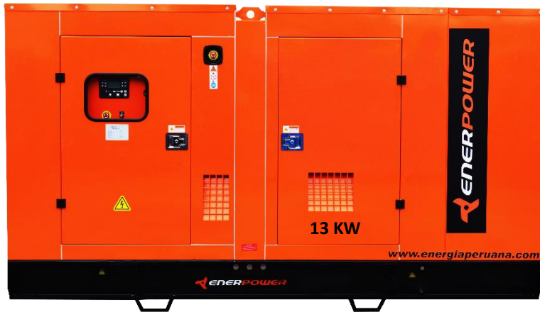
GRUPO ELECTRÓGENO INSONORIZADO