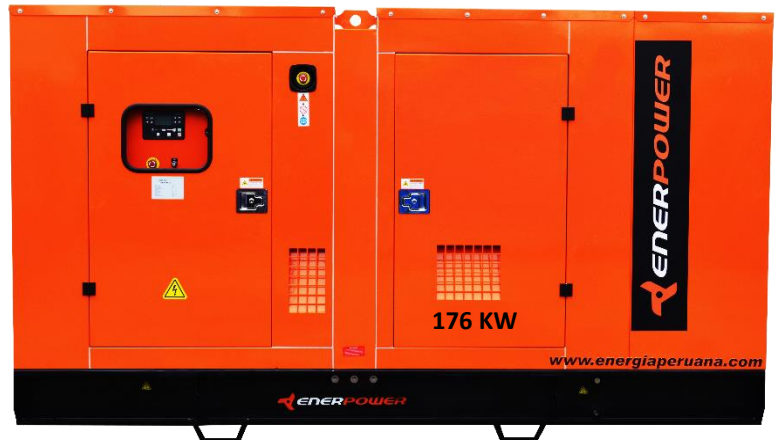
GRUPO ELECTRÓGENO ENCAPSULADO