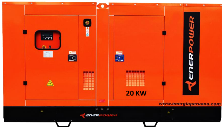
GRUPO ELECTRÓGENO INSONORIZADO