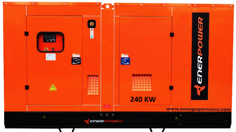
GRUPO ELECTRÓGENO ENCAPSULADO