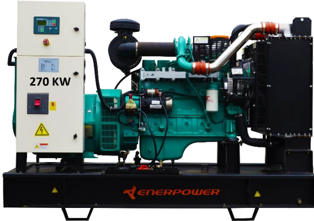
GRUPO ELECTRÓGENO ABIERTO