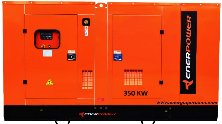
GRUPO ELECTRÓGENO ENCAPSULADO