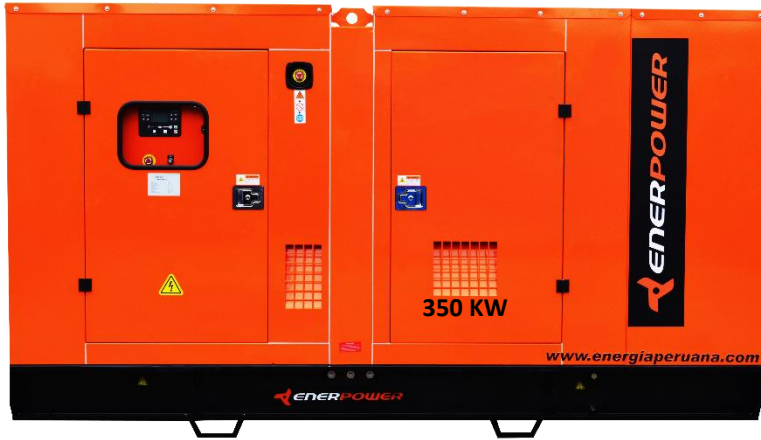
GRUPO ELECTRÓGENO INSONORIZADO