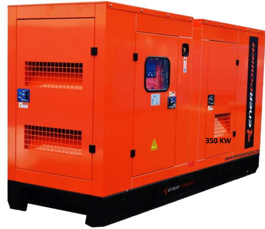
GRUPO ELECTRÓGENO INSONORIZADO