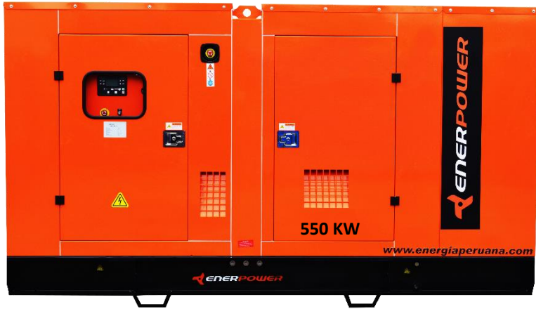
GRUPO ELECTRÓGENO INSONORIZADO