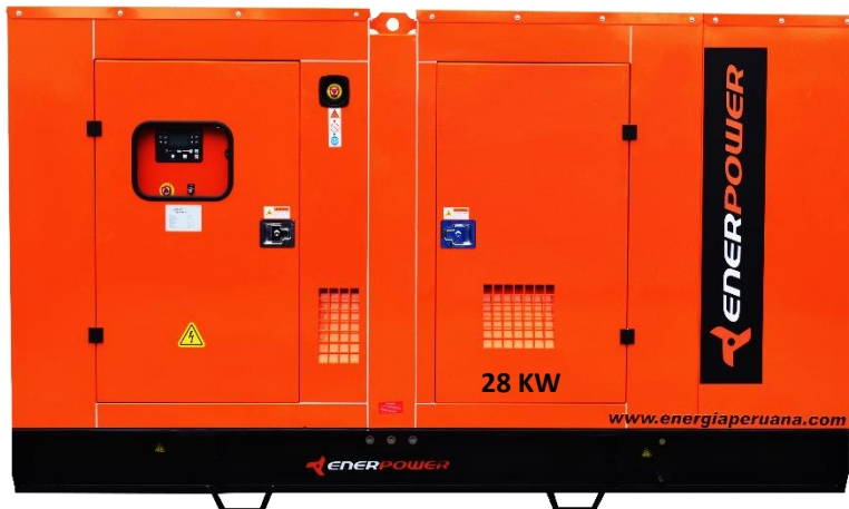
GRUPO ELECTRÓGENO ENCAPSULADO