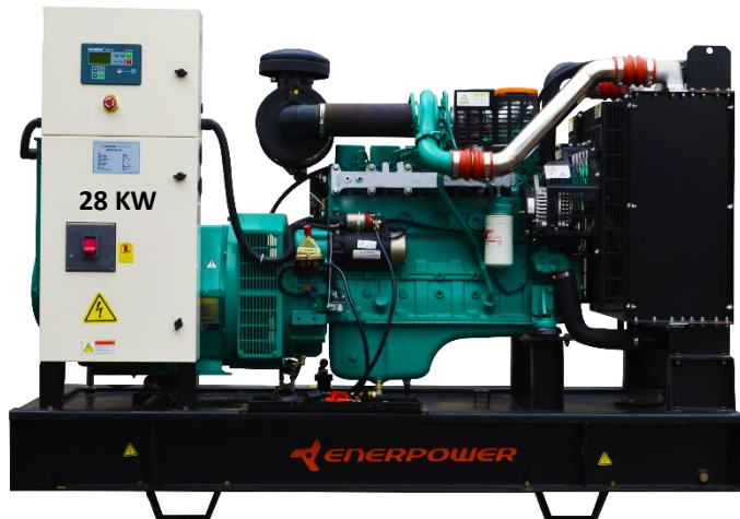
GRUPO ELECTRÓGENO ABIERTO