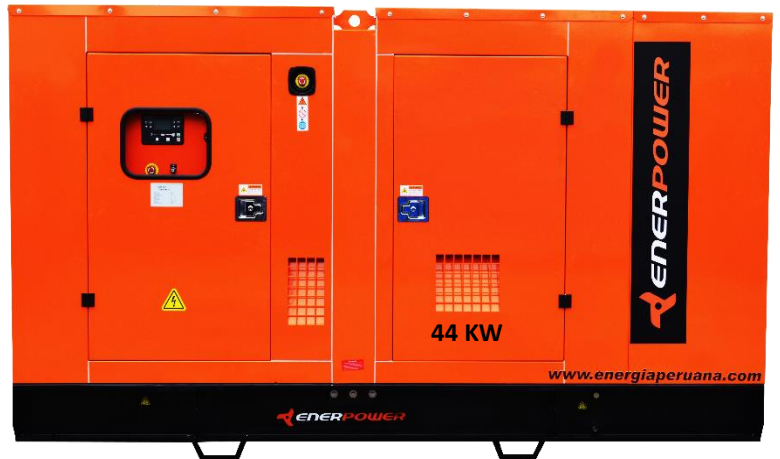
GRUPO ELECTRÓGENO ENCAPSULADO