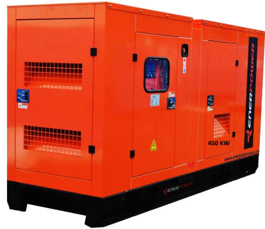
GRUPO ELECTRÓGENO INSONORIZADO