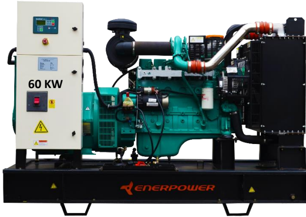
GRUPO ELECTRÓGENO ABIERTO