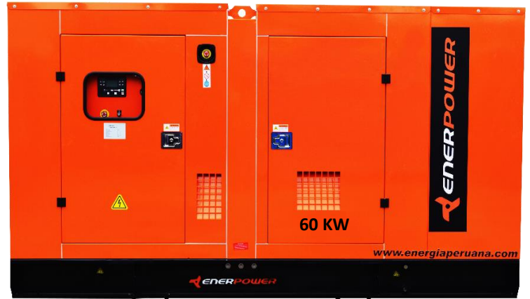
GRUPO ELECTRÓGENO ENCAPSULADO