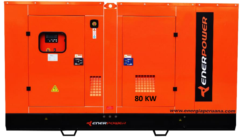
GRUPO ELECTRÓGENO ENCAPSULADO